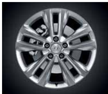
Jantes em liga leve 18''