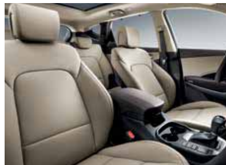
Pele bege em 2 tonalidades (também disponível em tecido).