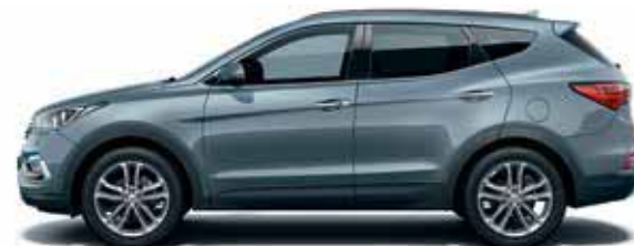
Mineral blue (VU2)