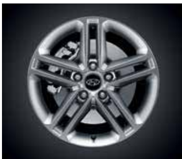
Jantes em liga leve 17''