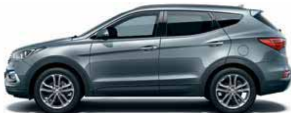
Titanium silver (T6S)