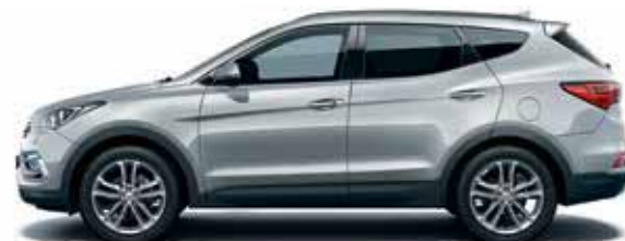
Platinum silver (T8T)