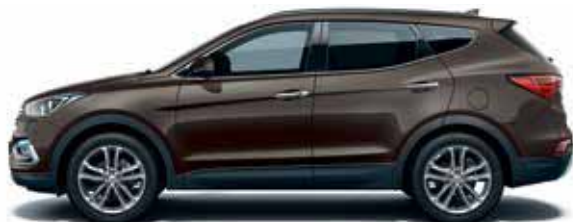
Tan brown (YΠ7)