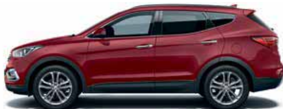
Red merlot (VR6)