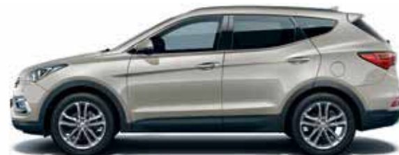
Chalk beige (VY2)