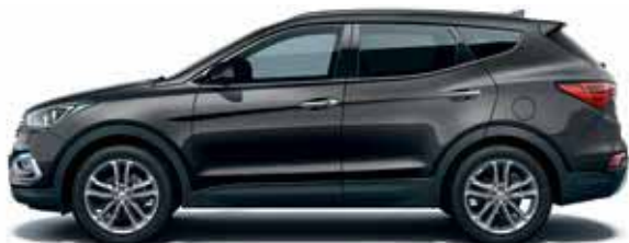
Phantom black (ΠΚΑ)