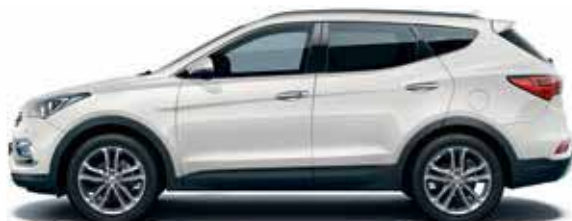
White crystal (PW6)

Para mais informações relativas ao Hyundai Santa Fe consulte http://www.hyundai.pt/