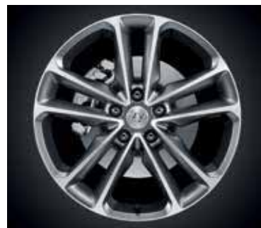
Jantes em liga leve 19''