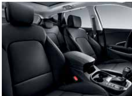
Pele de cor preta (também disponível em tecido).