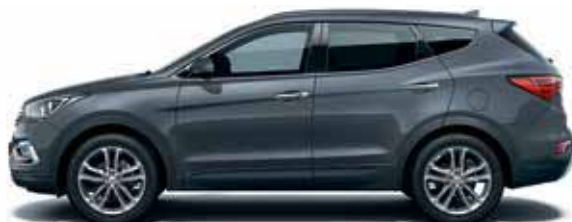
Ocean view (W8U)