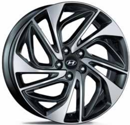
Jantes em liga leve de 19"*