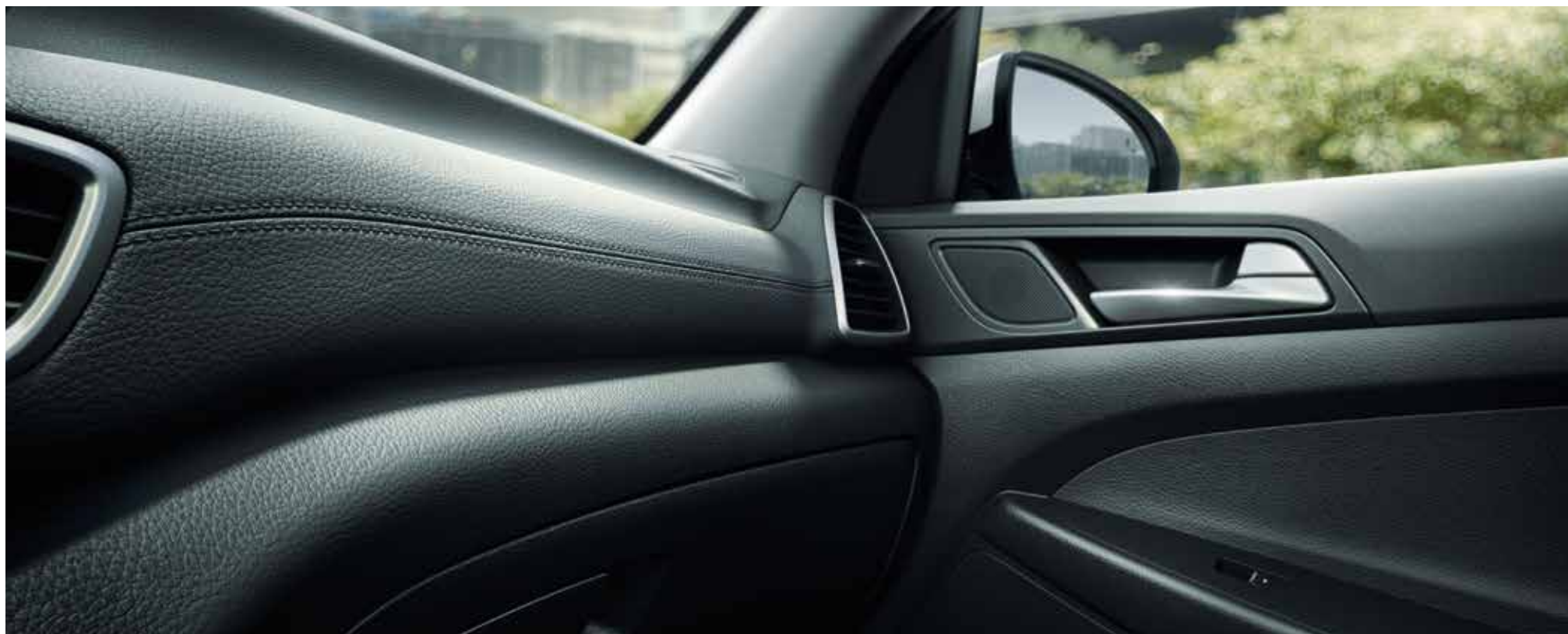
Design interior - Revestido com materiais suaves ao toque de elevada qualidade com costura dupla.