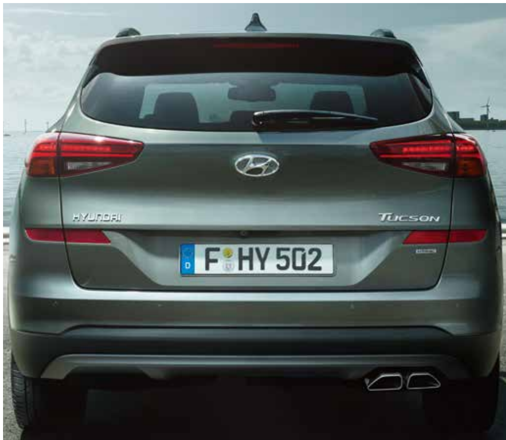
Para-choques traseiro redesenhado