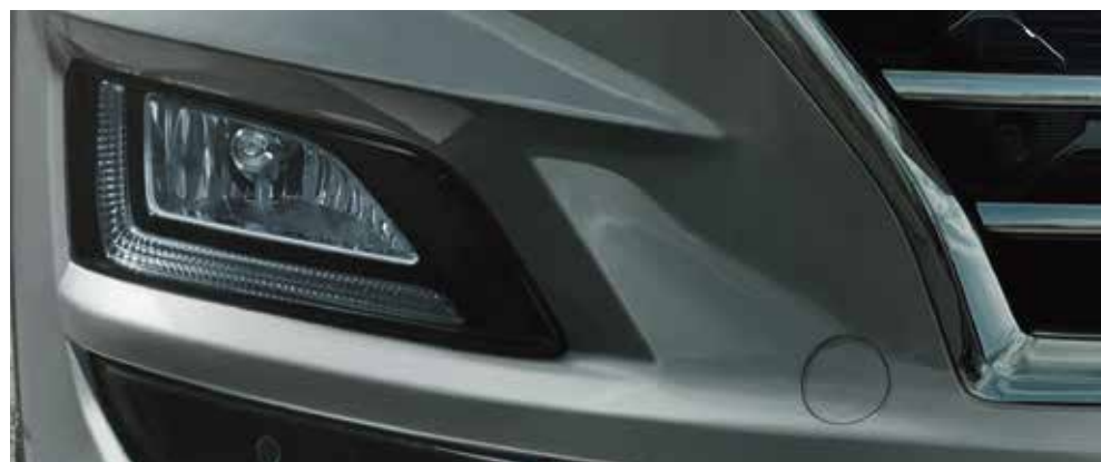
Faróis de circulação diurna em LED