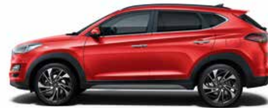
Engine Red (JHR)*