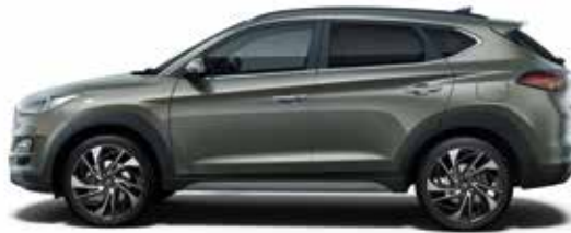
Olivine Grey (X5R)