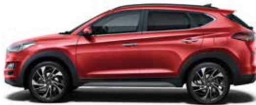
Fiery Red (PR2)