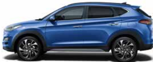
Ghampion Blue (U2U)