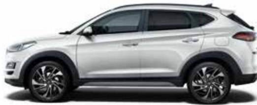
Platinun Silver (U3S)