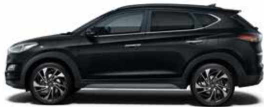
Phantom Black (PAE)