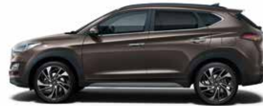
Moon Rock (XN3)