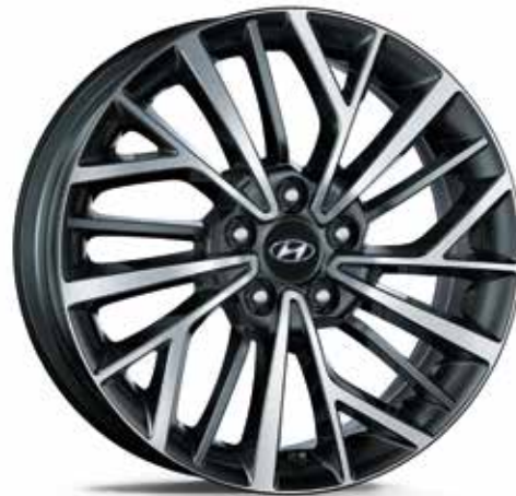
Jantes em liga leve de 18"

*equipamento disponível apenas nos pacotes opcionais: Style e Style Plus