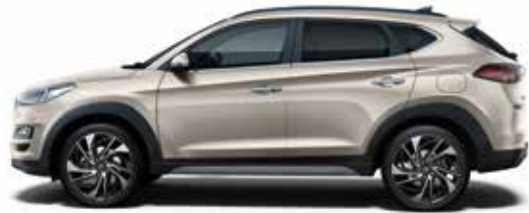
White Sand (Y3Y)