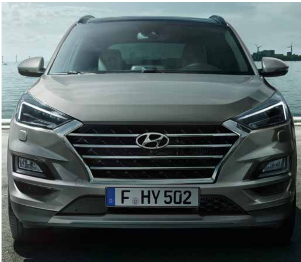
Grelha em cascata

Novos detalhes no design do novo Tucson.