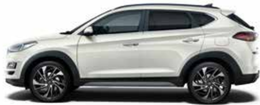
Polar White (PYW)*