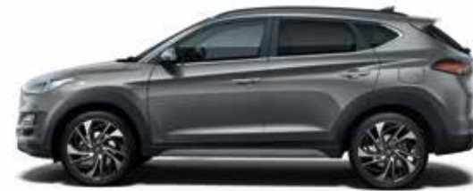
Micron Grey (Z3G)