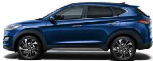
Stellar Blue (RWB)