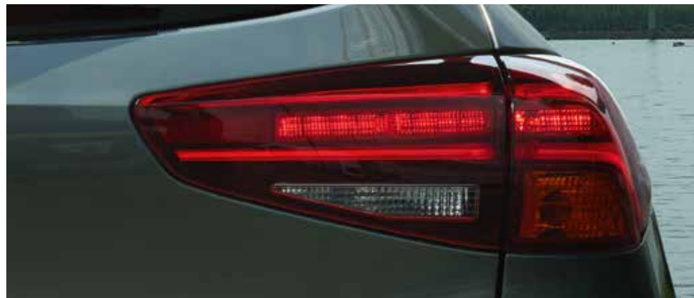
Grupos óticos traseiros em LED Dupla ponteira de escape