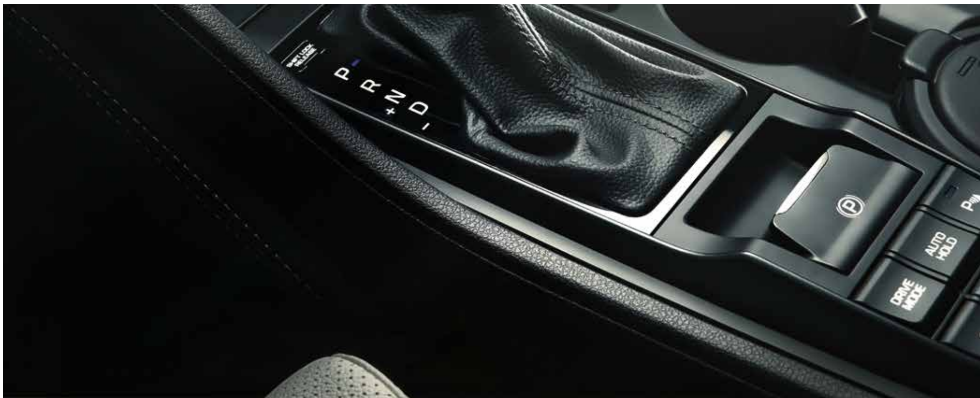
Travão de mão elétrico – Situado abaixo da caixa de velocidades.