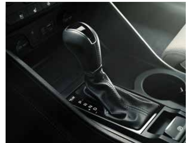
Caixa manual 6 velocidades Caixa de dupla embraiagem de 7 velocidades (DCT)