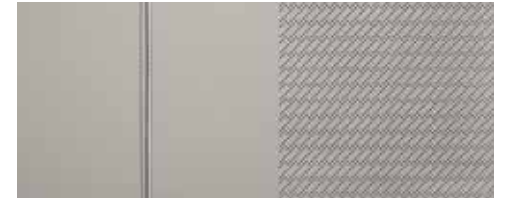
Pele cinza clara