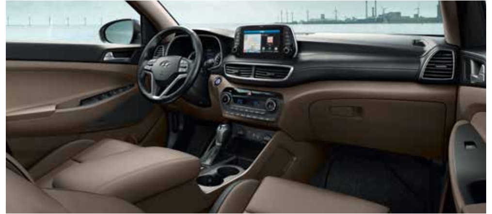
Bege dois tons