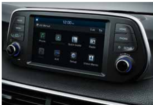
Ecrã tátil de 7" com Apple Carplay™ e Android Auto™